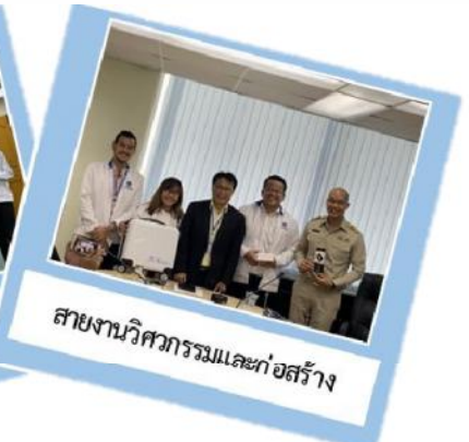
สายงานวิศวกรรมและก่อสร้าง