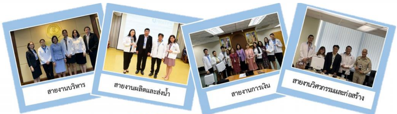
สายงานบริหาร