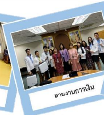
สายงานการเงิน