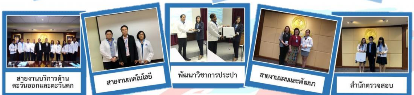
สายงานบริการด้าน ตะวันออกและตะวันตก