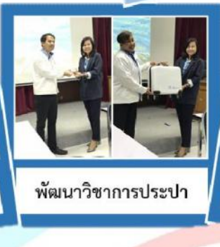
พัฒนาวิชาการประปา