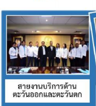
สายงานบริการด้าน ตะวันออกและตะวันตก