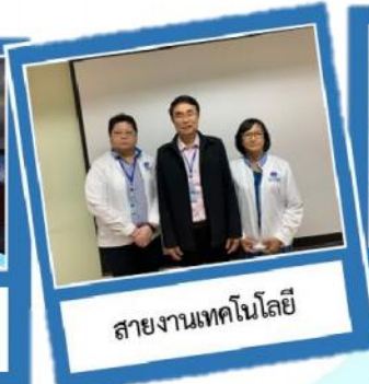
สายงานเทคโนโลยี