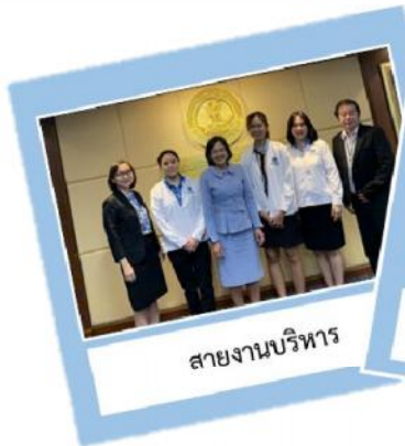
สายงานบริหาร

QWATER Change Agents สื่อสารและปฏิบัติตนเป็นแบบอย่างตามค่านิยมองค์กรแก่บุคลากรในหน่วยงาน และรายงานการดำเนินงานในระยะไตรมาสที่ 3 และ 4 พร้อมหลักฐานตามหลักเกณฑ์ QWATER Point ทั้งนี้ QWATER Change Agents ที่ได้รับคะแนนสูงสุดของแต่ละค่านิยม และแต่ละสายงาน จะได้รับเกียรติบัตรยกย่องชมเชยจากผู้ว่าการ