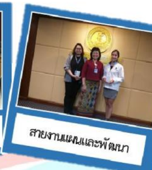
สายงานแผนและพัฒนา