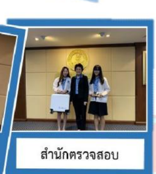
สำนักตรวจสอบ