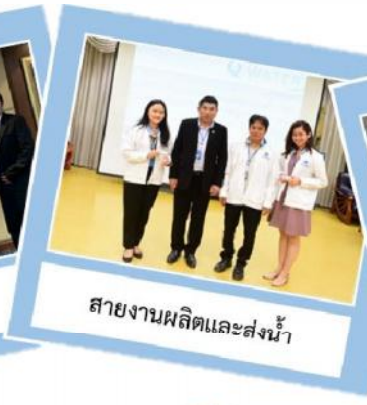
สายงานผลิตและส่งน้ำ