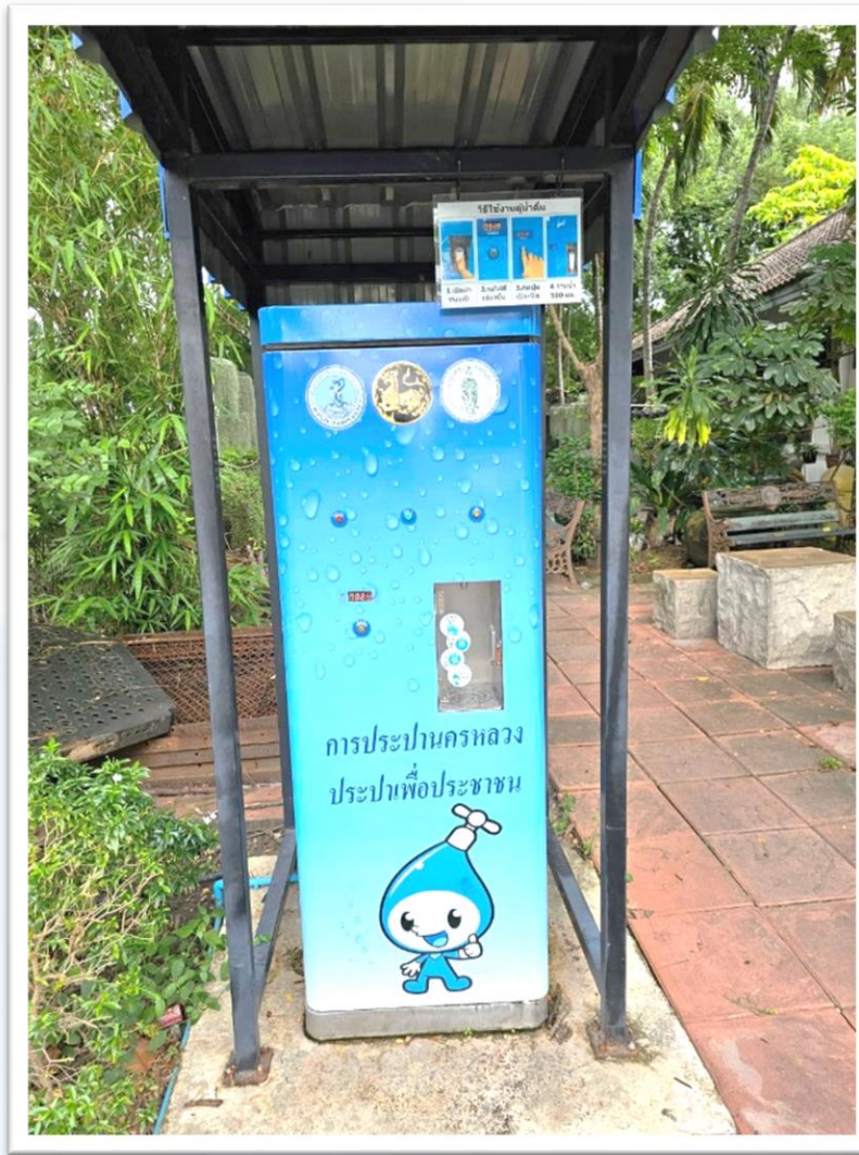
สวนจตุจักร