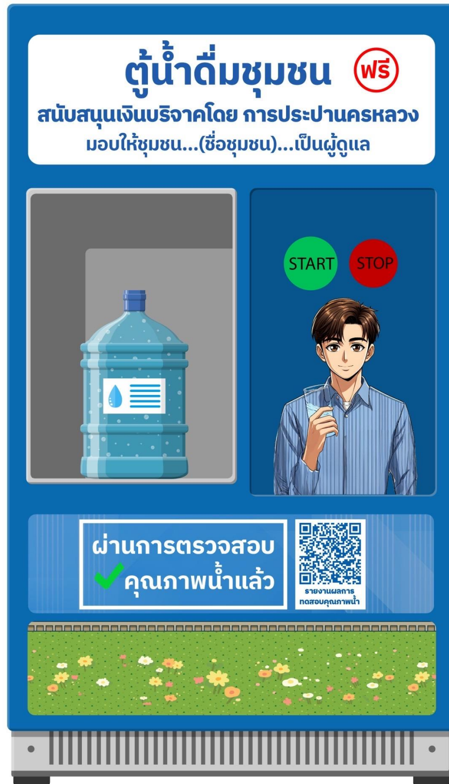
รูปแบบตู้ น้ำดื่มชุมชน