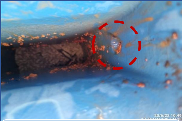
(ก่อนล้าง) พบคราบตะกอนเกาะภายในห้องน้ำ และหลุม Sensor