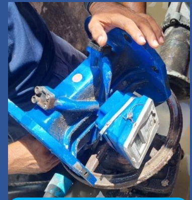
ขณะถอดล้าง